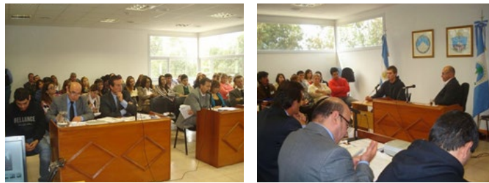
Imagen de sala de juicio actual

el otro es para el abogado defensor y el acusado. Detrás de las partes y frente al juez se ubica el público. A la derecha o a la izquierda del juez se ubica el jurado. Finalmente, entre el jurado y el juez, hay un atril donde declara el testigo.